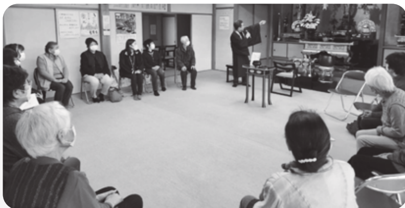
【蓮正寺サロンの様子】住職さんのご厚意により場所をお借りして開催しています

まずは、蓮正寺サロンやイベントの開催などをきっかけとして「顔の見える関係づくり」から取り組む「上日出谷ささえ愛隊」に、ご理解とご協力をお願いします。