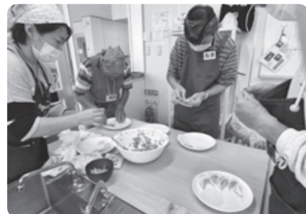
餃子づくりに初挑戦!