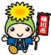
桶川市マスコットキャラクター オケちゃん