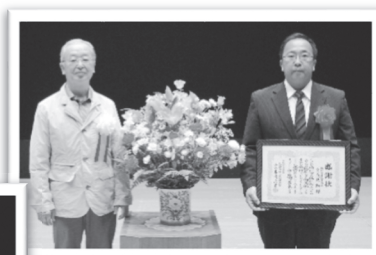
◎桶川市建設業協会 様