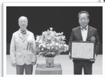
◎ライオンズクラブ国際協会 330-C地区 桶川ライオンズクラブ 様

また、令和3年度中に社会福祉協議会に対して、多大なるご寄附をいただきました皆様に、おけがわ春のふれあいフェスタ開会式において、岩崎会長より感謝状を贈呈いたしました。