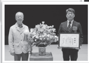
◎上尾遊技業組合 様