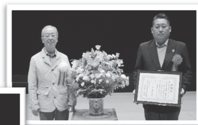
◎株式会社 大宮ゴルフコース 様