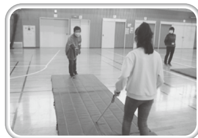
見えないと進むのにも時間がかかります…