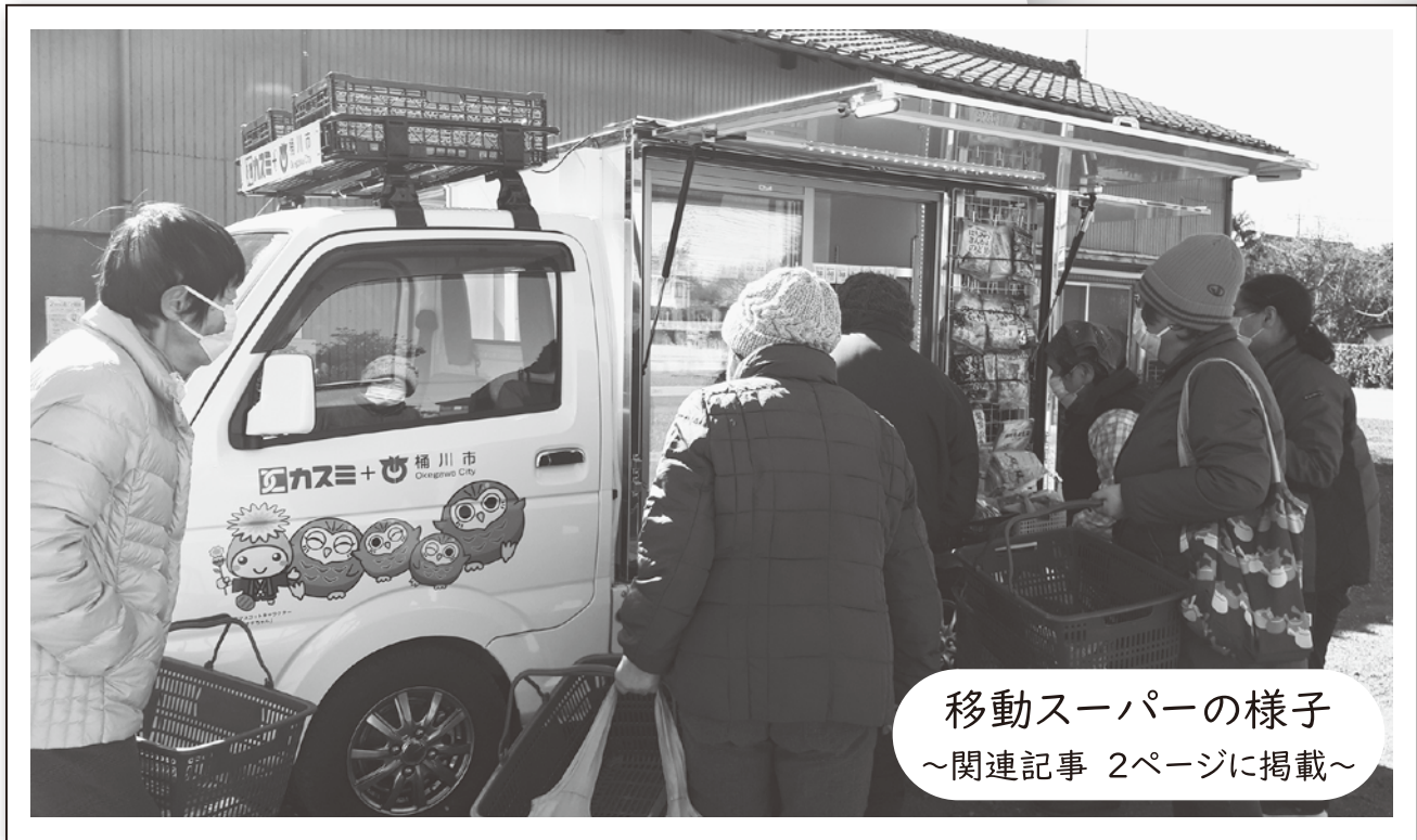
移動スーパーの様子 ～関連記事 2ページに掲載～