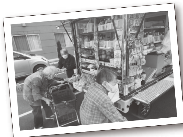
移動販売がスタートしました

※詳しい運行スケジュール（曜日・時間）については、桶川市のホームページをご覧ください。