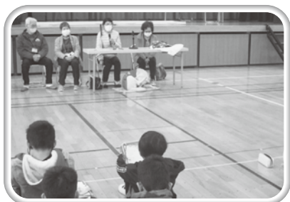
団体の活動内容などを話していただきました。

車いす体験では、「住みよい桶川をつくる会」の皆様にご協力をいただき、アイマスク体験では、「桶川ドリームクラブ」と「紅花の里視力障害者友の会」の皆様にご協力をいただき実施をしました。実施の際に、ご協力をいただきましたボランティアの皆様、本当にありがとうございました。住みよい桶川をつくる会、桶川ドリームクラブ、紅花の里視力障害者友の会の活動に興味のある方は是非、当社協へお問い合わせください。