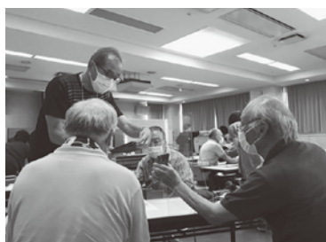
LINE 講座はシニア男性にも好評でした！

ど、高齢者の方もチャレンジされています。 ・子ども食堂の利用者にも、お弁当の提供（市内でも子どもたちのために取り組んでいらっしやいます。） 《オンラインでおしゃべり》 ・担い手ボランティア入門講座シリーズで、Zoomとラインの操作お手伝いボランティア養成講座を開催したところ、とても好評でした。