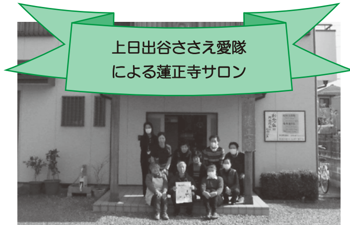
上日出谷ささえ愛隊 による蓮正寺サロン

いつまでも住み慣れた地域（自宅）で自分らしく暮らしたい！ 市（社協）では、日常生活圏域（地域包括支援センター圏域）ごとに協議体（話し合いの場）を設置して、住民主体で地域づくりを考えるための話し合いをすすめています。