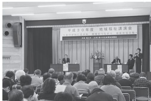
第3部 地区社協 活動発表の様子