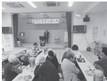
△老人福祉センターの様子